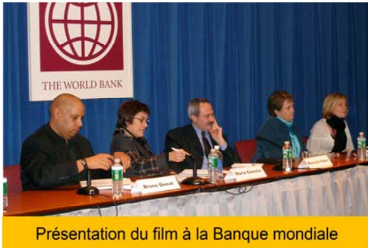
Présentation du film à la Banque mondiale

Développement international (DFID) au Royaume Uni, au Réseau européen pour l'Afrique Centrale (EUREC) en Belgique ainsi que plusieurs événements en France.