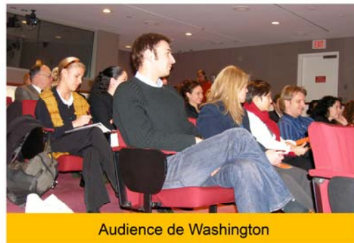
Audience de Washington

Une fois que la production en masse du DVD sera complétée, le film sera distribué aux acteurs clés du programme ainsi qu'à des membres du corps académique, de la presse, des programmes nationaux, et des bailleurs de fonds dans le cadre d'une campagne de collecte de fonds et de conscientisation.