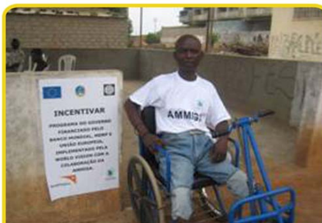
Un ex-combattant en Angola

De façon générale, les Angolais sont-ils au courant de l'action de l'IRSEM ?