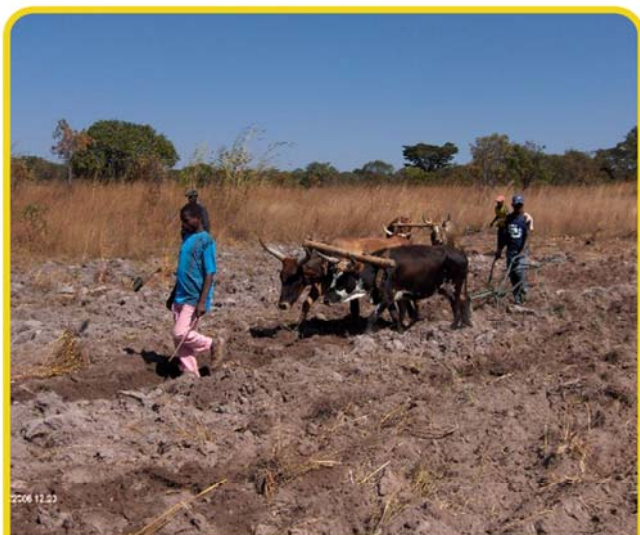
Des bénéficiaires du programme travaillant dans les champs

Les leçons dégagées et les recommandations des évaluations externes suggèrent une amplification des objectifs du programme et son intégration à une stratégie formulée aux niveaux national et local, dans une perspective de développement social et économique.