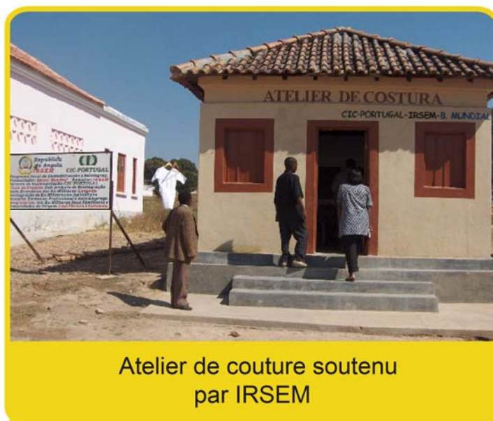
Atelier de couture soutenu par IRSEM

Les circonstances du conflit lui-même rendirent plus difficile l'accès aux endroits où se trouvaient les ex-combattants, restreignant ainsi l'action aux principaux centres urbains où certaines activités restaient possibles auprès du groupe cible.