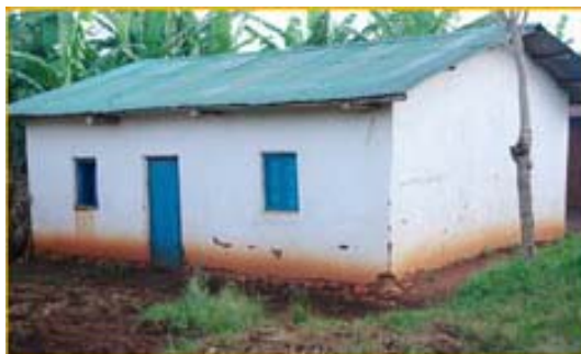
La maison des Wacawasems

Sadi devint alors un bon élève pendant une période d'une année. Peu après cette formation, Sadi trouva une opportunité de perfectionner ses nouvelles connaissances. Il s'inscrit à une formation de mécanique automobile à Makamba, offerte aux démobilisés par une ONG. Après six mois, il reçut son certificat ainsi qu'une caisse à outils.